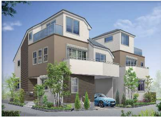
●完成予想図:図面に基に描き起こしたもので、実際とは多少異なります。