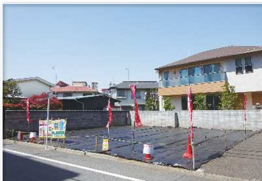
●現地写真(平成30年5月撮影)